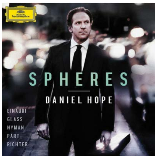
Spheres (Daniel Hope) Piste: «I Giorno (Ludovico Einaudi)»